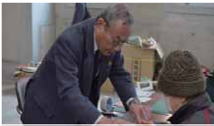
熊本県畳工業組合 (ものづくり)