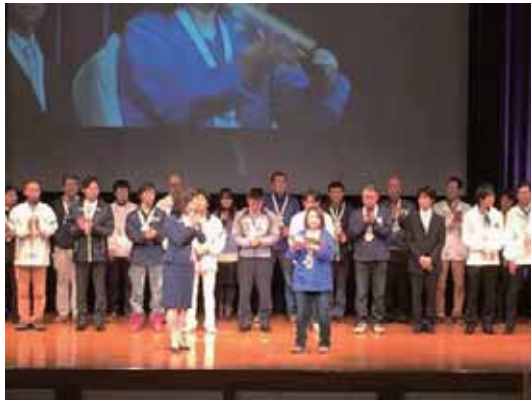
▲厚生労働大臣賞受賞