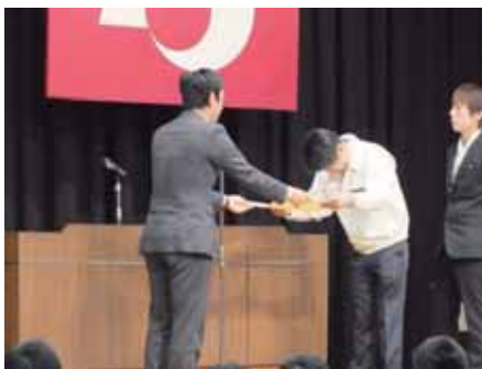
各級の代表者交付