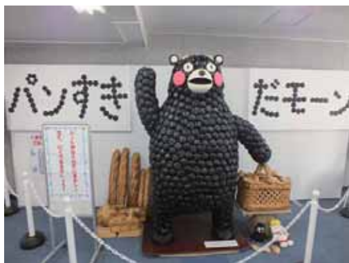
▲くまモンをモチーフにしたパン ▼和菓子の練り切り体験