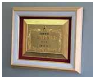
④ 1級(大) ガラス額入り ¥32,000

技能士としての誇りを持ち、社会的・経済的地位の向上に資するため、技能士章を掲げましょう。 また技能士カード・技能士手帳は、携帯に便利な商品です。