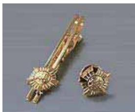
⑰ ネクタイピン ¥1,300