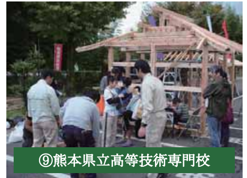
㉔熊本県立高等技術専門学校