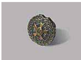
⑯ 全技連バッチ ¥1,600