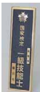
⑦ 1級屋外用門標 ¥11,000 (縦 34.8 cm 横 10.7 cm 厚さ 1 cm)