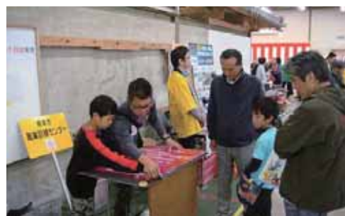
⑫熊本市職業訓練センター