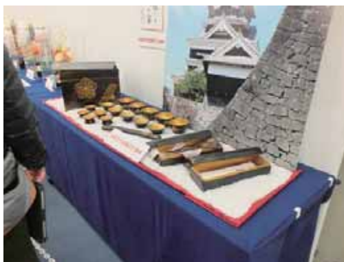
▲陶磁器の展示 ▼どらやきの体験・販売