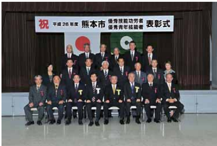
▲熊本市優秀技能功労者