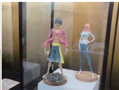
▲人気キャラクターをモチーフにしたお菓子 ▼お菓子の展示