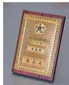
⑥ 1級机上用 ¥14,500 ダイカスト仕上げ(級別) (縦 23.8 cm 横 16.6 cm 厚さ 2.8 cm)