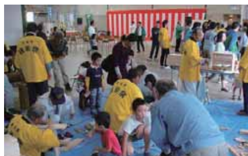
⑪熊本県建設大工工事業協同組合