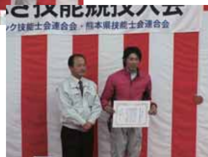
▶優勝した末吉選手と東理事長