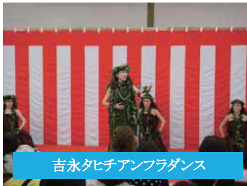
吉永タヒチアンフラダンス