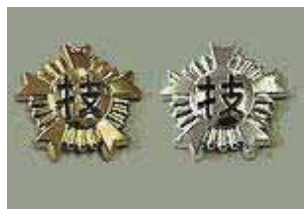
⑲ ヘルメットマーク 各 ¥700 (1級金色、2級銀色) (直径 4.0 cm)