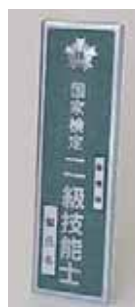
⑪ 2級屋外用門標 ¥10,000 (縦 34.8 cm 横 10.7 cm 厚さ 1 cm)