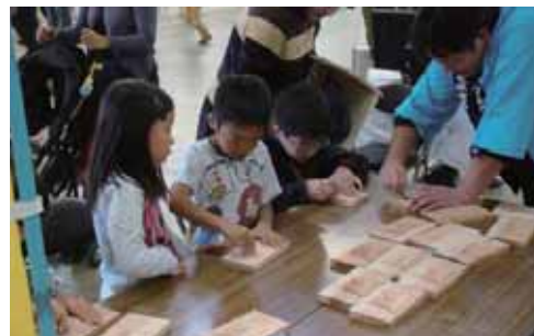
③熊本県建具木工協同組合