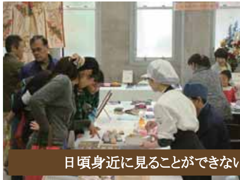
日頃身近に見ることができない匠の技やマイスターとの話ができる交流の場所となりました。