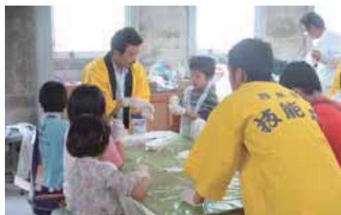
④熊本県左官協同組合