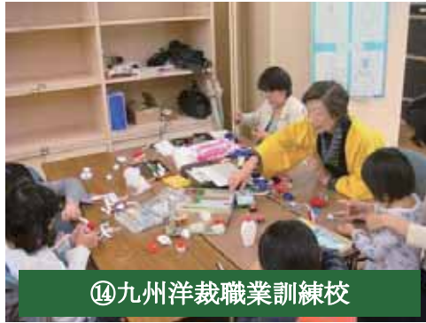
⑭九州洋裁職業訓練校