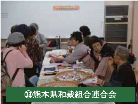
⑬熊本県和裁組合連合会