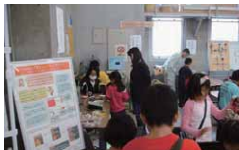
⑧熊本県立技術短期大学校