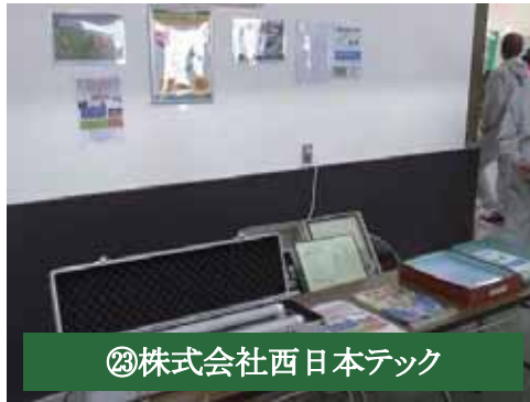
㉓株式会社西日本テック