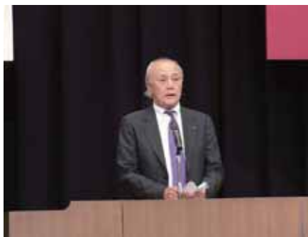
合格者へ激励をする笹原会長