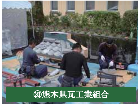
⑳熊本県瓦工業組合