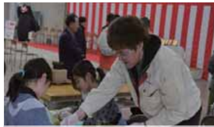
熊本県左官協同組合青年部 (ものづくり)