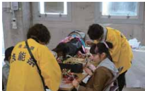
①熊本県フラワー装飾技能士会