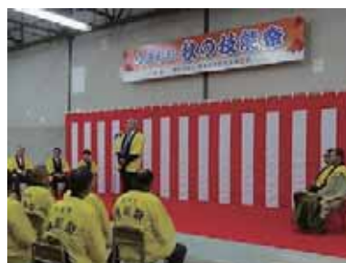
挨拶をする笹原委員長