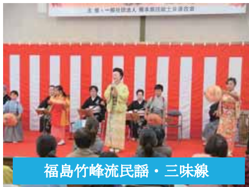
福島竹峰流民謡・三味線