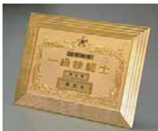
⑤ 1級(大) 店頭用 ¥19,500