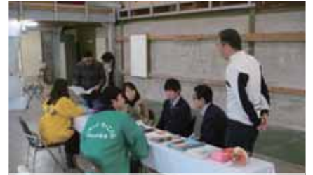
職業・業界相談コーナー 熊本県技能士会連合会