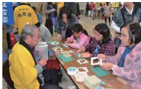
⑤熊本県畳工業組合