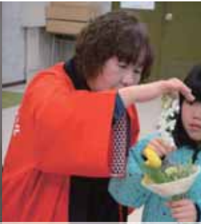
國實尚美 (フラワー装飾)