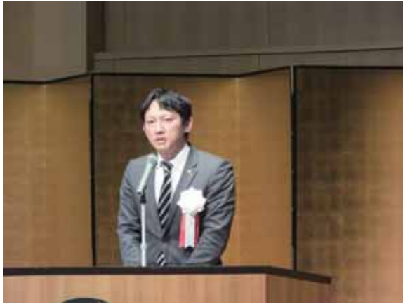
▲挨拶する小野泰輔副知事

この大会は、熊本県、熊本県職業能力開発協会、（一社）熊本県技能士会連合会が主催し、職業能力開発や技能振興に功績が認められる「団体や個人」を表彰し、その功績を広く讃え、もって職業能力の振興を図るために開催されています。