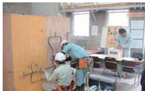
⑨熊本県立高等技術専門校