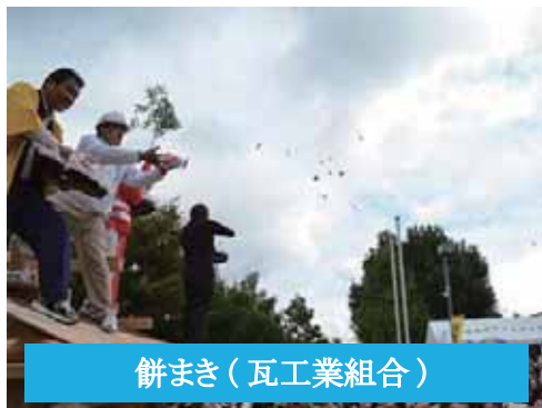
餅まき(瓦工業組合)