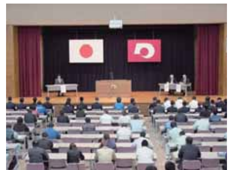
合格者証書交付式会場