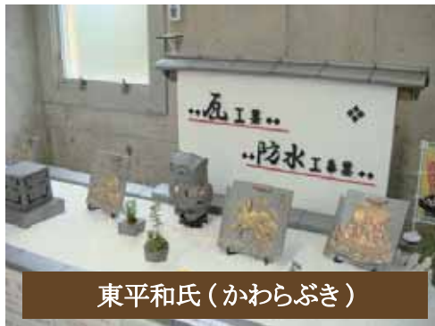
東平和氏(かわらぶき)