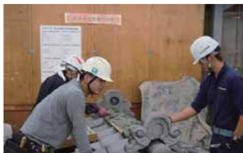
⑦熊本市技術専門学院