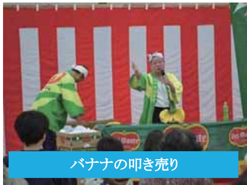
バナナの叩き売り