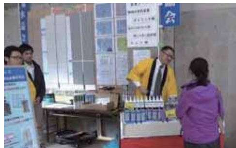
②(一社)熊本県防水工事業協会