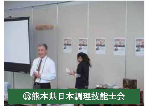
⑮熊本県日本調理技能士会