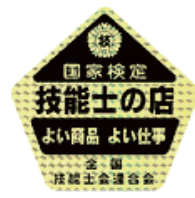
⑳ シール (2枚1組) ¥1,000