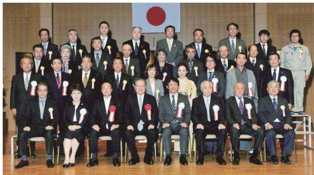
▲熊本県知事表彰受賞者