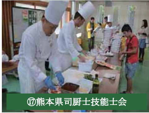
⑰熊本県司厨士技能士会