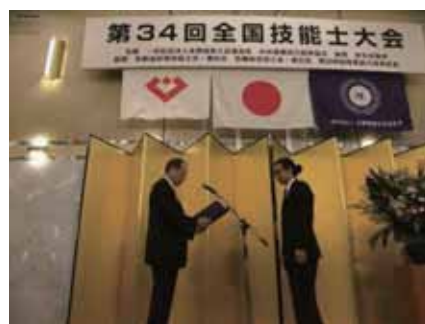
▶全技連マイスター 認定証交付