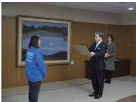
▲県知事賞を授与する蒲島知事