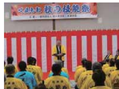
挨拶をする橋口建設業協会会長