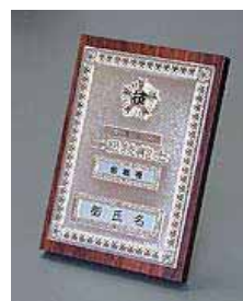
⑩ 2級机上用 ¥13,000