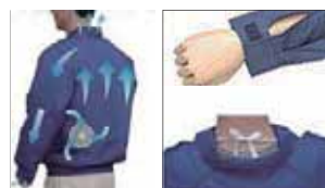
空気の流れのイメージ