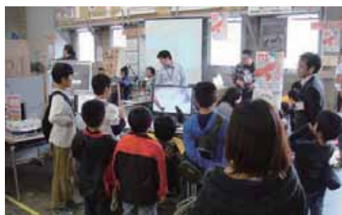
⑩身体障害者ソフトウェア開発訓練センター