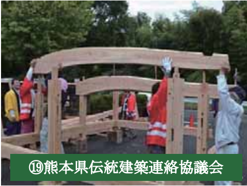
⑲熊本県伝統建築連絡協議会