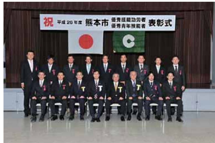
▲熊本市優秀青年技能者