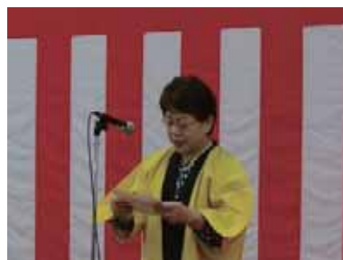
挨拶をする熊本県宮尾局長