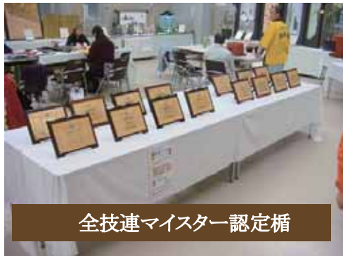
全技連マイスター認定楯