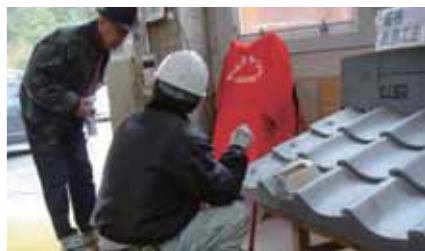
東 平和（かわらぶき）