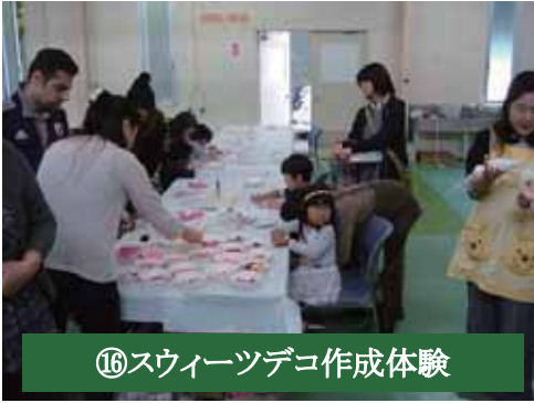
⑯スイーツデコ作成体験