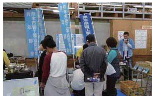
⑥熊本県管工事業協同組合連合会