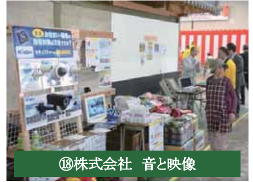
⑱株式会社 音と映像